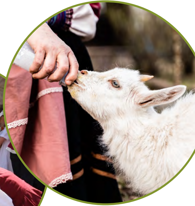
ファームで 動物への餌やり

ファームステイは、休日にリラックスした環境の中で様々な体験を希望するゲストを歓迎します。ファームステイ先の家族の一員となり、田園の暮らしを体験しましょう。