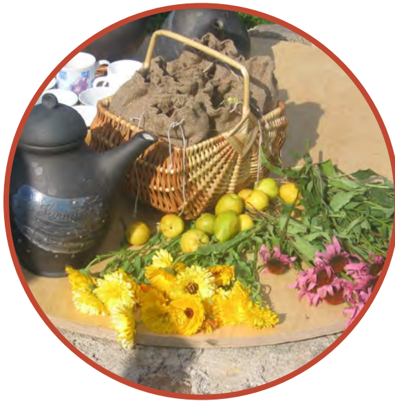
小規模ファームでの体験

古くから続くファームや工房を訪ねて田園の息吹を発見したり、何世代にも渡って受け継がれてきた現代にも生きるユニークな伝統を実際に目にしてみましょう。