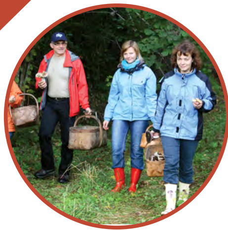
きのこ狩りと料理教室

古くから続くファームや工房を訪ねて田園の息吹を発見したり、何世代にも渡って受け継がれてきた現代にも生きるユニークな伝統を実際に目にしてみましょう。