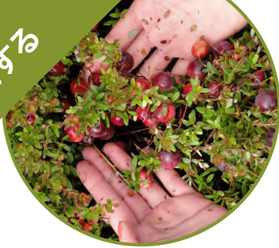
果物や野菜の収穫