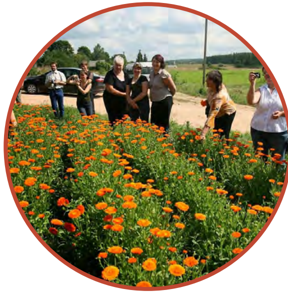
ハーブと自然を学ぶ