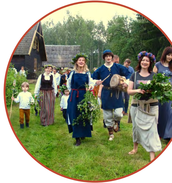
伝統的なお祭りを祝う